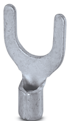
Gabelkabelschuh, unisoliert, 1,1 - 2,5 mm 2 , M6

Bitte beachten Sie, dass die hier angegebenen Daten dem Online-Katalog entnommen sind. Die vollständigen Informationen und Daten entnehmen Sie bitte der Anwenderdokumentation. Es gelten die Allgemeinen Nutzungsbedingungen für Internet-Downloads. ( http://phoenixcontact.de/download )